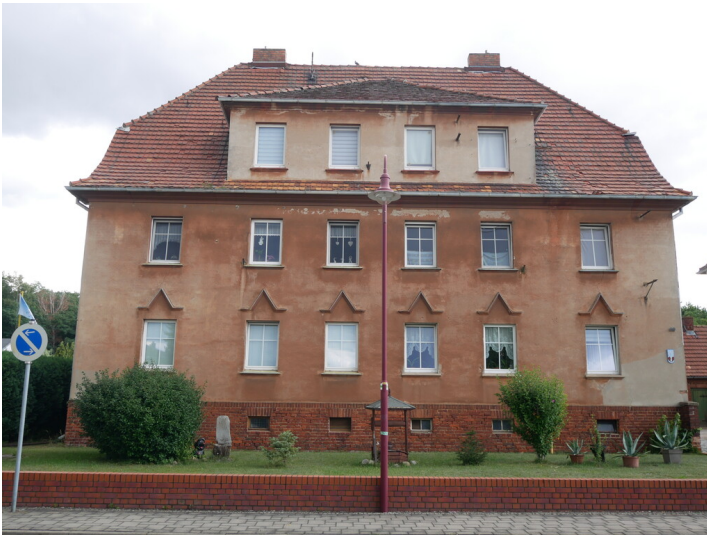
Mehrfamilienhäuser Zentralwerkstatt