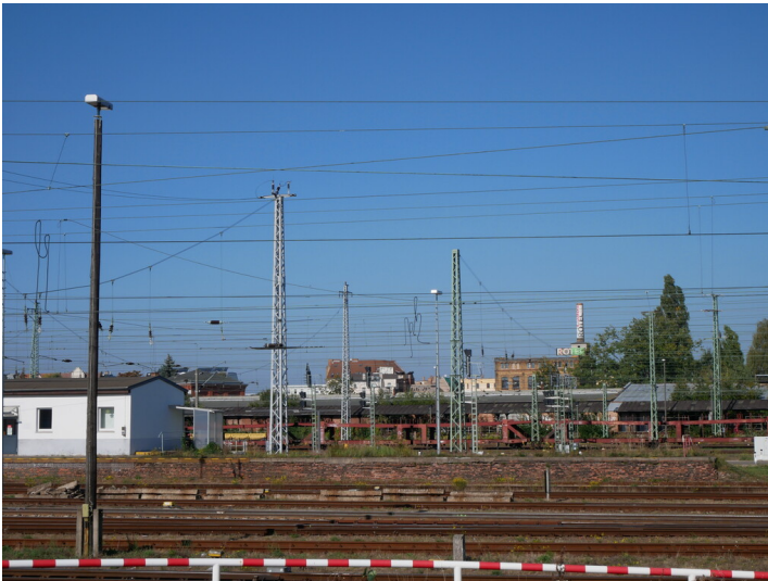
Güterbahnhof Cottbus