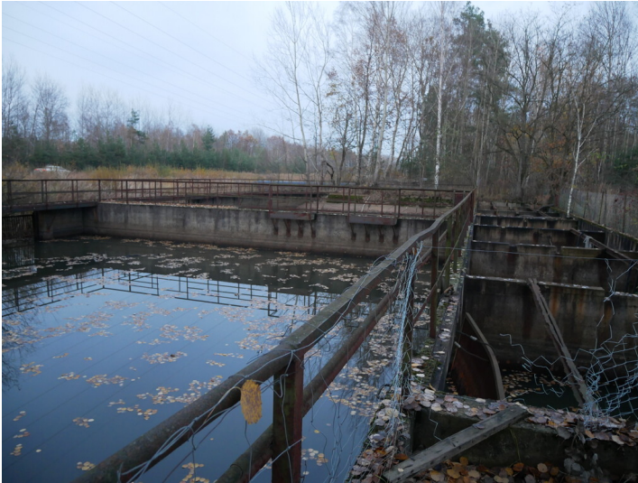
Gosdaer Wasserschloss