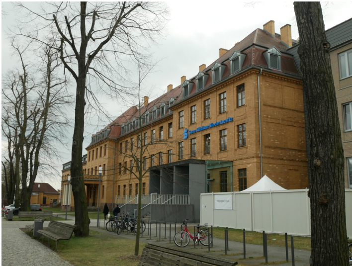
Knappschaftskrankenhaus mit Einfassung und Nebengebäuden