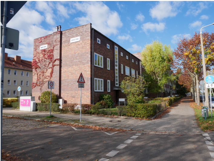
Wohnanlage Huttenplatz