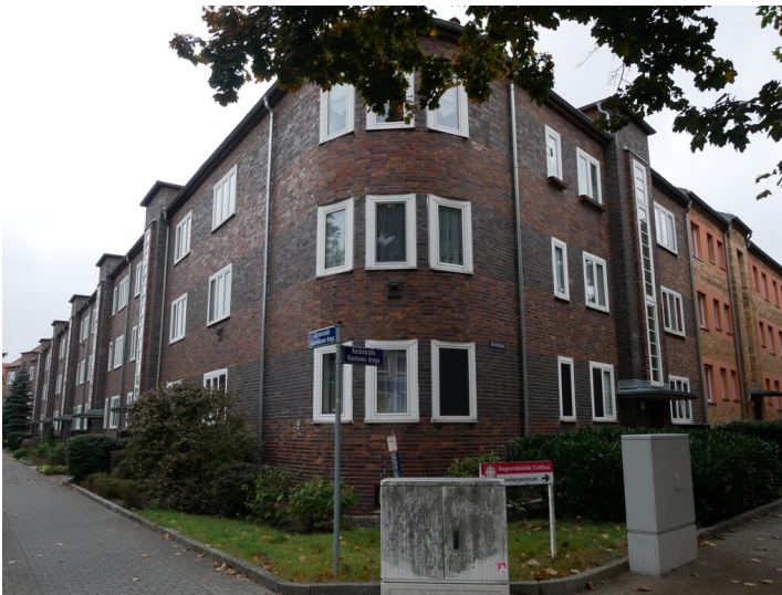
Wohnanlage Joliot-Curie Straße, ehemalige Gewoba-Wohnanlage Friedrich Ebert