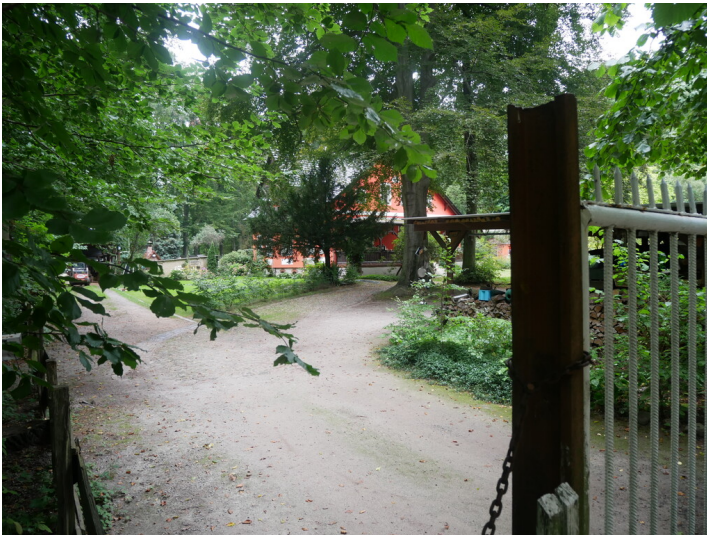
Gutshof der Ziegelei