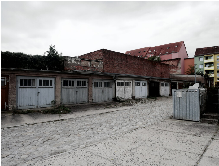
Brauerei Friedrichstraße