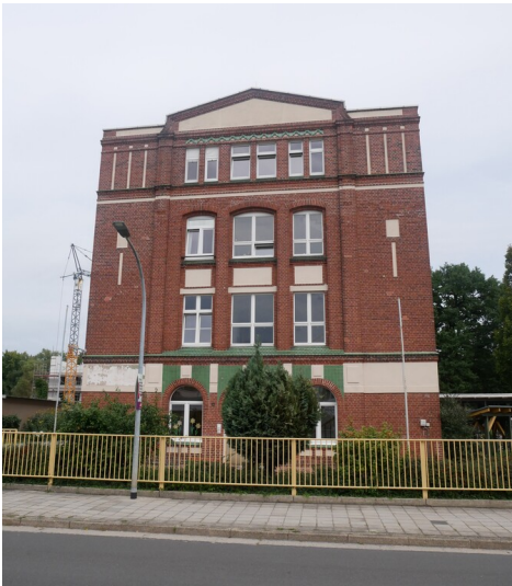
Textilfabrik Schwetasch & Seidel