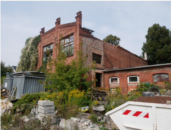
Brauerei Dresdener Straße