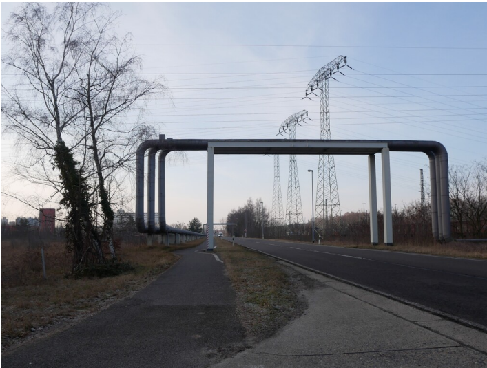
Kraftwerk Jänschwalde Fernwärmeversorgung (2023)