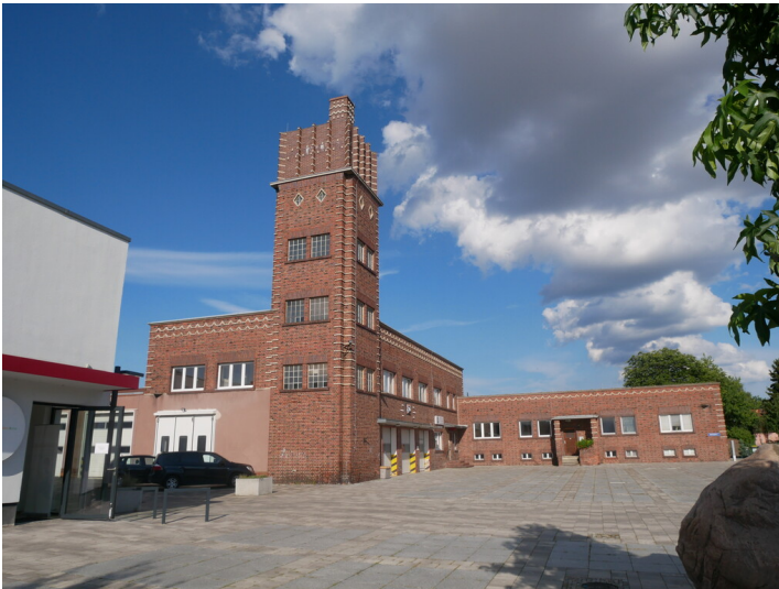
Feuerwehrdepot mit Wohntrakt