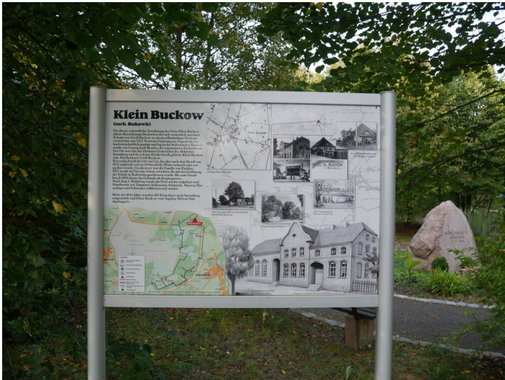
Ortsdenkmal Klein Buckow