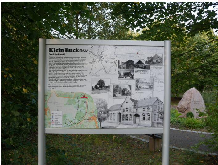
Ortsdenkmal Klein Buckow