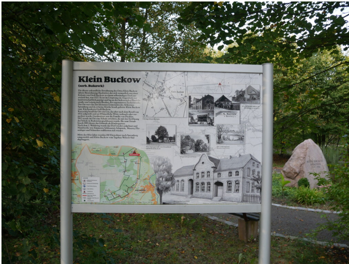
Ortsdenkmal Klein Buckow