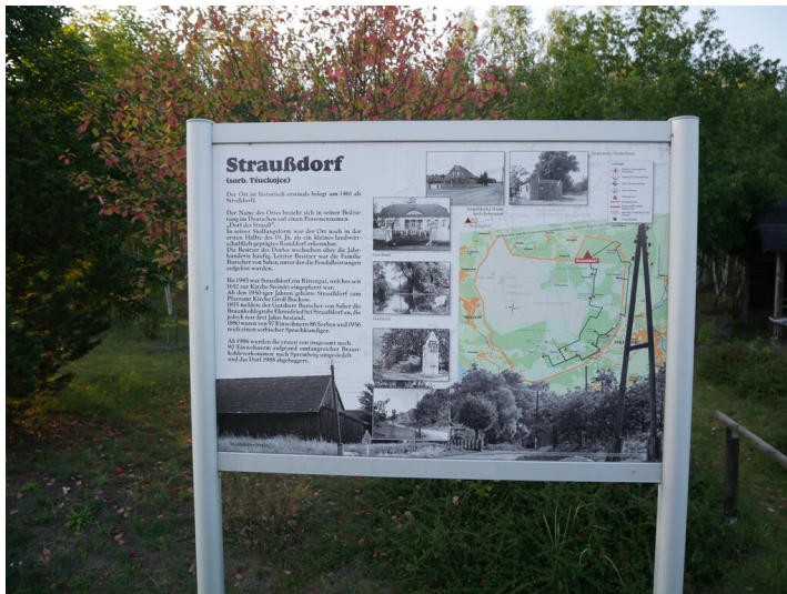
Ortsdenkmal Straußdorf/Tsuckojce