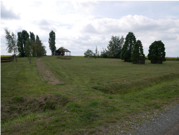
Stradower Höhe