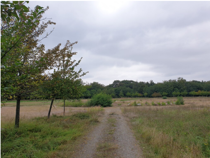
Bergmannspark und Gleispromenade