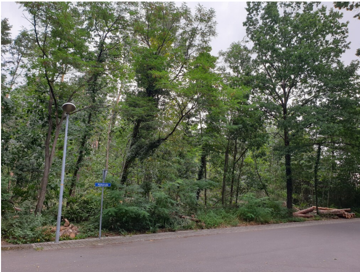
Waldpark Welzow