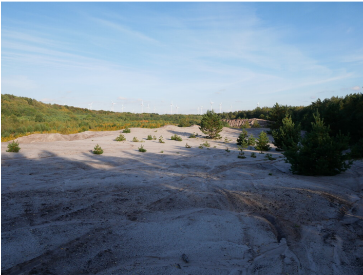
Abraumkippe des Tagebaus Friedländer