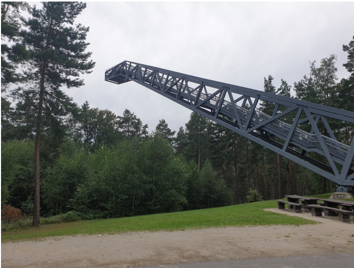
Steinitzer Treppe

Schlagwörter: Aussichtsturm Fachsicht(en): Denkmalpflege Gemeinde(n): Drebkau Kreis(e): Spree-Neiße Bundesland: Brandenburg