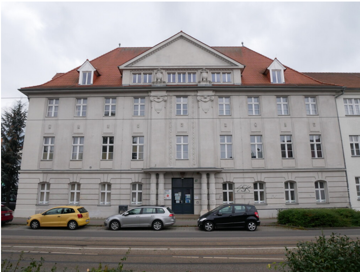
VEB Energieversorgung Cottbus