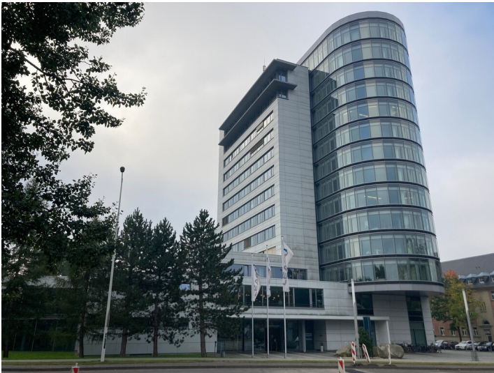
LEAG Hauptverwaltung