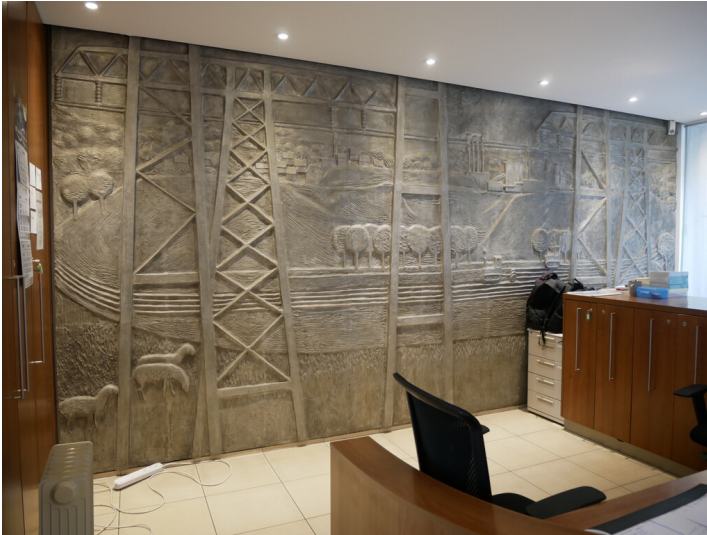
Verwaltung des VEB Energiekombinats Cottbus