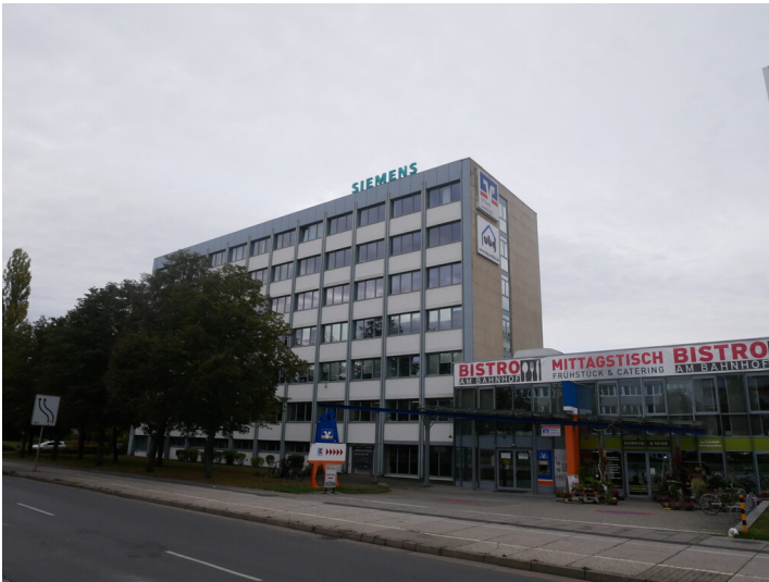
VEB BMK, KB Industrie- und Hochbau