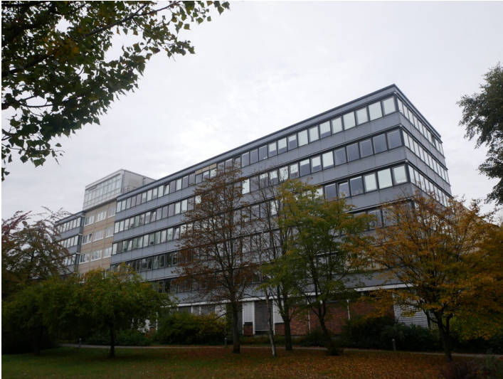
VEB BMK, KB Forschung und Projektierung