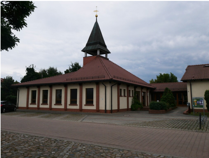
Kirche Neu-Kausche