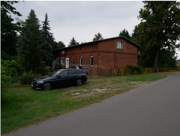
Wohnhaus Fotograf/Urheber: Franz Dietzmann