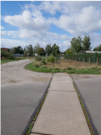
Glaswerk Drebkau