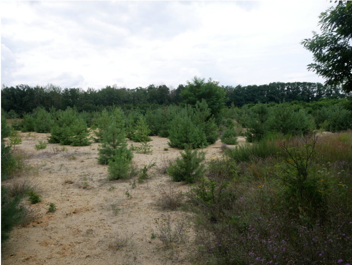
Messfläche Tagebau Welzow-Süd