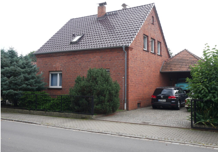
Siedlung Kurzer Weg