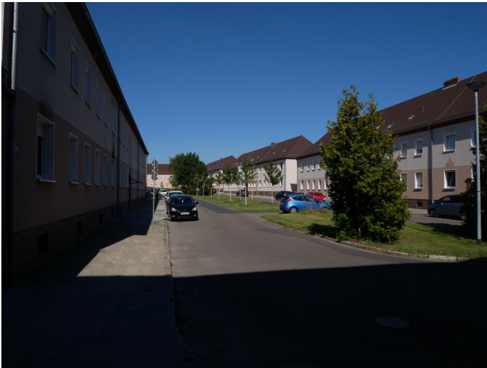
Siedlung Glück-Auf