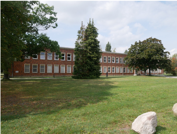
Poliklinik Schwarze Pumpe