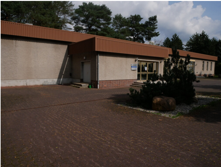
Suhler Klubhaus und Bergmannszimmer