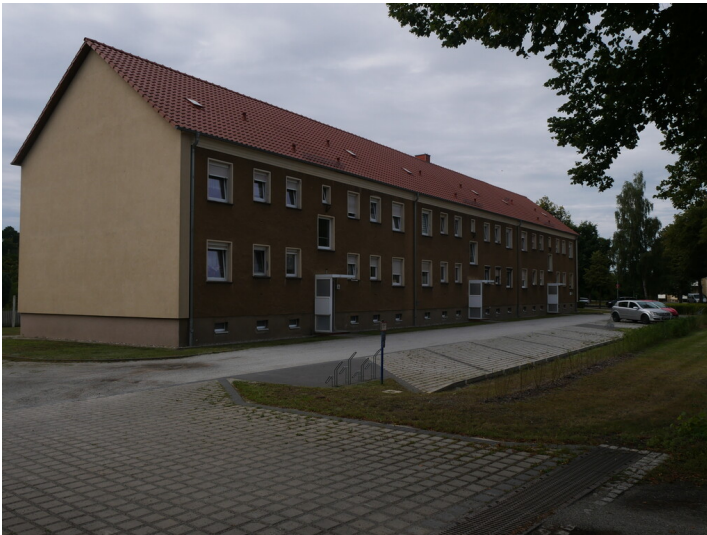
Gebäude der WBG Glückauf Drebkau