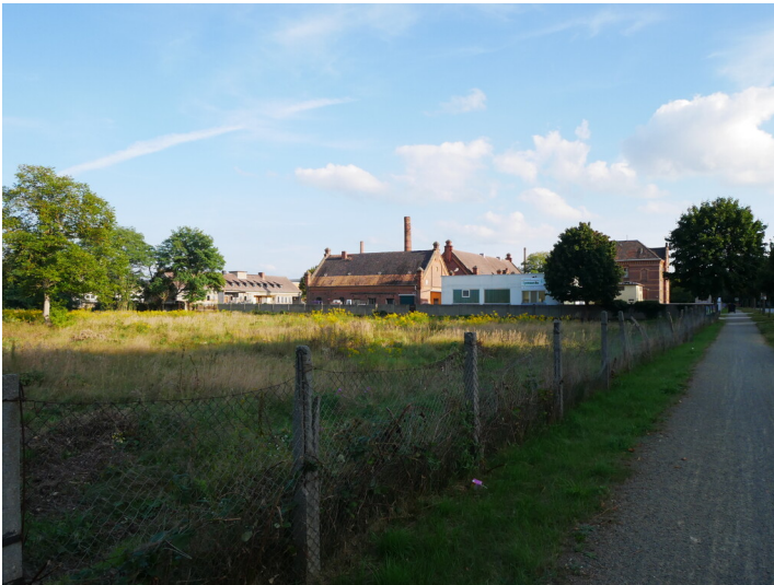
Schlachthof Spremberg