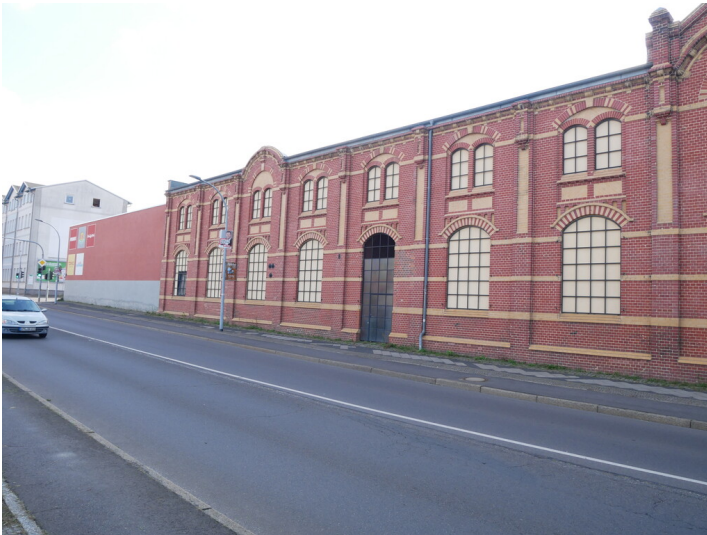
Pappenfabrik Nitschke

Schlagwörter: Fabrikgelände Fachsicht(en): Denkmalpflege Gemeinde(n): Spremberg Kreis(e): Spree-Neiße Bundesland: Brandenburg