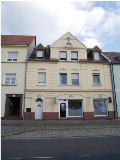
Wohn- und Geschäftshaus Karl-Marx-Straße 61