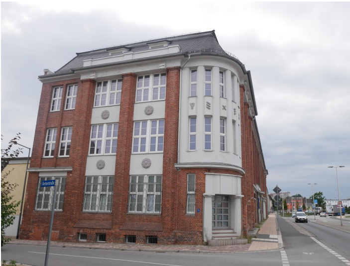
Tuchfabrik C. A. Krüger

Schlagwörter: Tuchfabrik Fachsicht(en): Denkmalpflege Gemeinde(n): Spremberg Kreis(e): Spree-Neiße Bundesland: Brandenburg