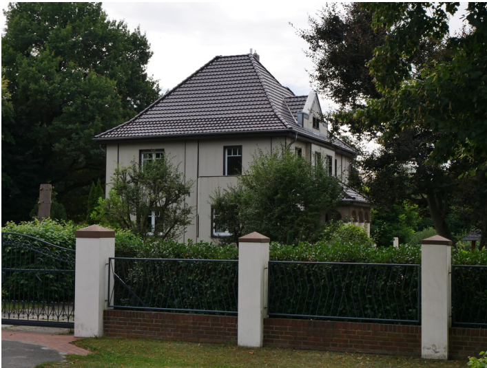
Fabrikantenvilla Drebkau Glaswerk