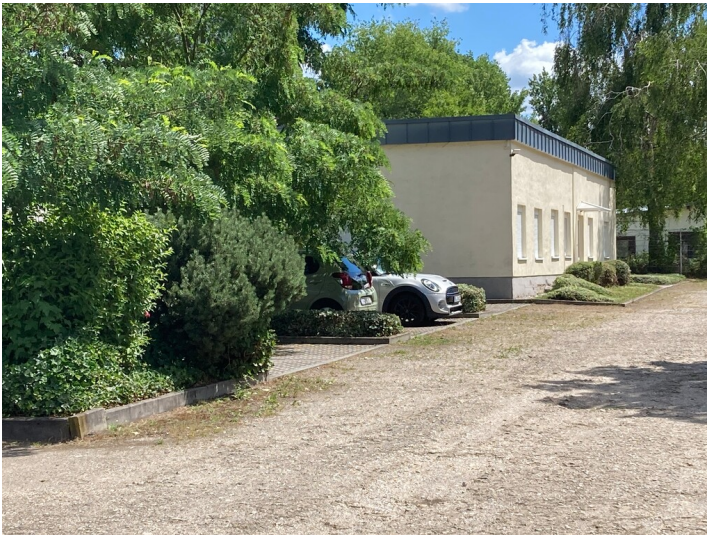
Tränkanlage des ehemaligen Braunkohlenwerks Dölitz, Blick von Norden.