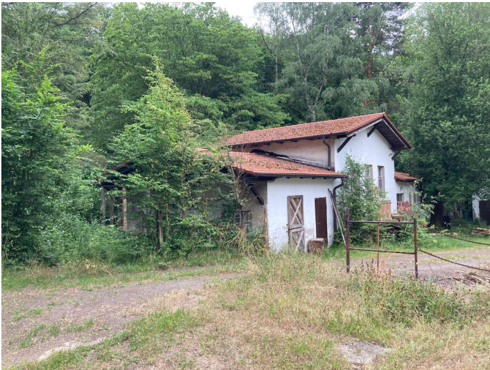
Ehemalige Kaue im Nordwerk des Königlich-Sächsischen Braunkohlenwerks Leipzig, Blick von Nordosten.