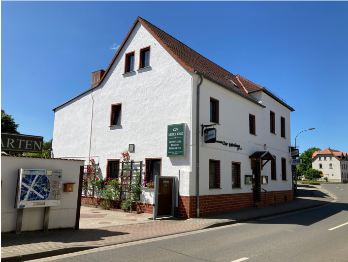
Gasthof und Pension »Zur Erholung«, Blick von Nordosten.