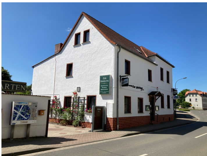
Gasthof und Pension »Zur Erholung«, Blick von Nordosten.