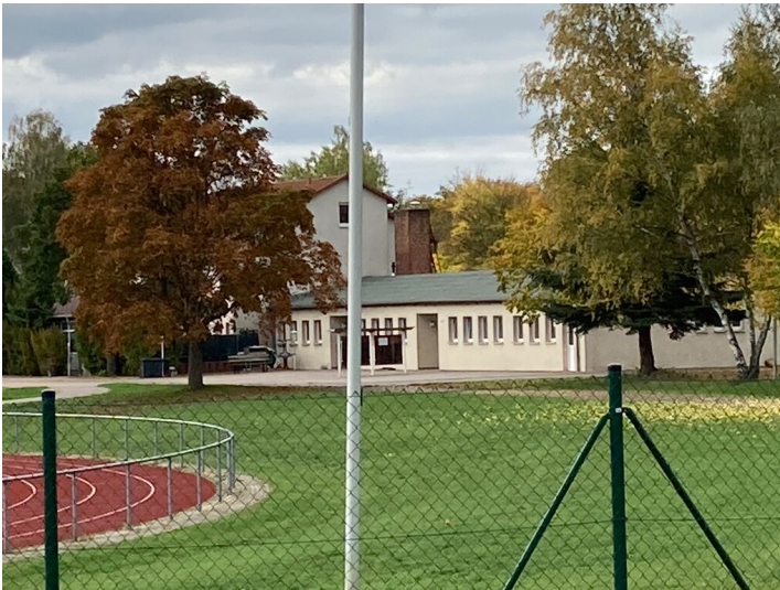
Dr.-Fritz-Fröhlich-Stadion, Blick von Osten.