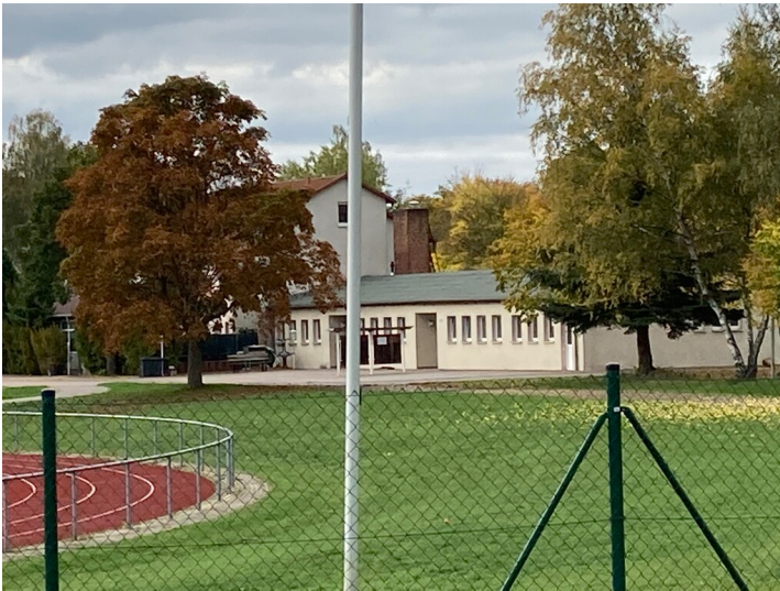
Dr.-Fritz-Fröhlich-Stadion, Blick von Osten.