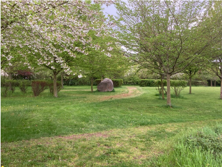
Parkanlage zum Gedenken an den überbaggerten Ort Heuersdorf, Blick von Norden.