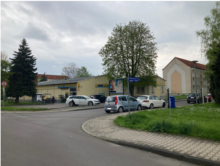
Ehemalige HO-Verkaufsstelle in der Siedlung der AWG »Völkerfreundschaft«, Blick von Nordwesten.