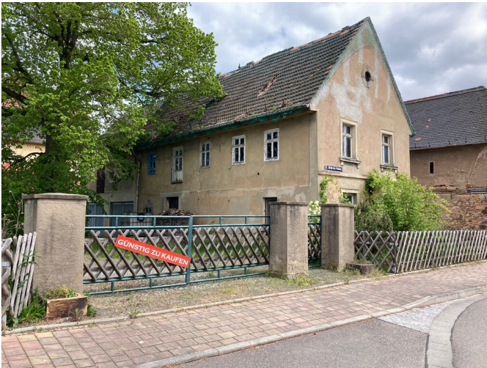
Teil der Objektgruppe Industriedorf Großzössen