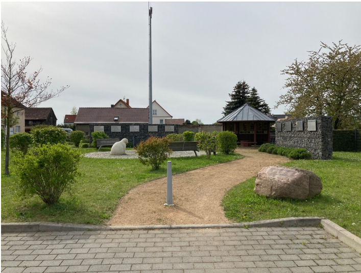
Heleneplatz, Blick von Osten.