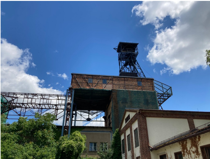
Schachtgebäude mit Förderturm und Alter Sortierung des ehemaligen Braunkohlenwerks Dölitz, Blick von Westen.