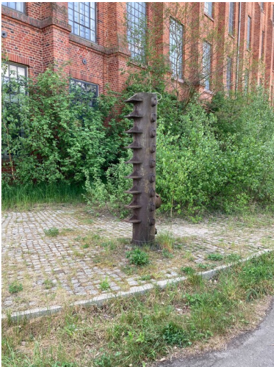
Eiserner Stützpfeiler eines ehemaligen Tellertrockners, Brikettfabrik Neukirchen, Blick von Südwesten

Schlagwörter: Brikettfabrik Fachsicht(en): Denkmalpflege Gemeinde(n): Borna Kreis(e): Leipzig Bundesland: Sachsen