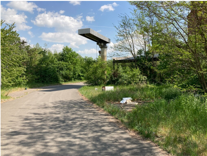
Kran und Laufkatze der ehemaligen Brikettfabrik Neukirchen, Blick von Nordwesten.