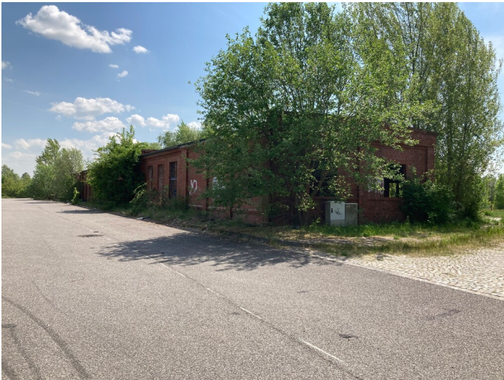
Werkstätten der ehemaligen Brikettfabrik Neukirchen, Blick von Norden.